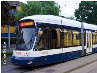
Tram transfrontalier Genève/Saint-Julien : régularité, rapidité et fréquence

■ Le tramway entre Genève et Saint-Julien serait la première ligne à être conçue dès son origine sur un modèle transfrontalier. Ce tram permettra de décongestionner la circulation automobile pour les quelques 20 000 frontaliers qui se rendent chaque jour à Genève. Avec une fréquence d'environ un tram toutes les 8 minutes, le temps de parcours entre St Julien et le site de Lancy Pont-Rouge (Genève) avoisinera les 25 minutes. INTERREG apporte son soutien aux études préliminaires et techniques.