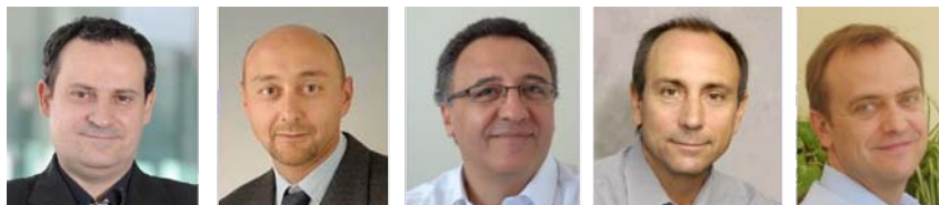
les porteurs du projet NANOBIUM

Le but de ce projet est de découvrir de nouvelles combinaisons à base de dioxyde de titane et de Niobium pour permettre une croissance optimale des cellules nerveuses humaines. Les nouveaux substrats nanostructurés et fonctionnalisés mis en place seraient uniques sur le marché de par leurs fonctionnalités. Ce projet pourrait ouvrir des pistes encore inexplorées pour la médecine régénérative. NANOBIUM est porté par la société 3D-Oxides (Ain) avec l'Université de Franche-Comté et par HEPIA avec le partenariat de la société suisse ABCD Technology.