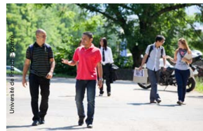
Campus de la Bouloie, Université de Franche-Comté

Le projet porté par l'Université de Franche-Comté et Arcjurassien.ch vise à développer les liens entre acteurs de la recherche, de l'innovation et de l'enseignement supérieur à l'échelle de l'Arc jurassien. Cette coopération dynamisée permettra de renforcer les formations partagées et la recherche conjointe dans les secteurs porteurs pour la région. Elle favorisera aussi les interactions avec les entreprises, ainsi que la valorisation de la recherche. Au total, 6 universités et établissements d'enseignement supérieur français et suisses sont associés au projet. 11 organismes économiques et professionnels sont également partenaires de la démarche.