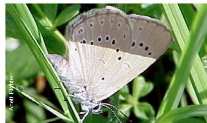
Le Maculinea , indicateur de la qualité de l'environnement

Le projet porté par Asters, Conservatoire d'Espaces Naturels de Haute-Savoie, et la Direction générale de l'environnement du Canton de Vaud consiste à élaborer un plan d'action en faveur des Maculinea sur l'ensemble du territoire. Cela passe notamment par une mise à jour des connaissances, la définition d'actions de sauvegarde de l'espèce à l'échelle transfrontalière et la sensibilisation autour du projet, notamment au niveau local.