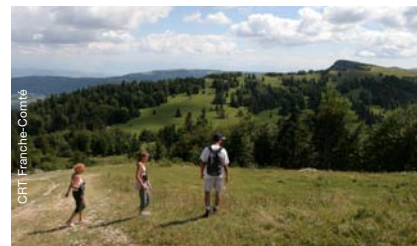
Balade au Mont d'Or

Initié par la Communauté de Communes du Mont d'Or et des 2 Lacs et Yverdon-Bains Région, le projet vise à coordonner la gestion des itinéraires , à harmoniser les offres de randonnées pédestres et VTT ainsi qu'à promouvoir les itinéraires dans leur globalité. 4 sentiers sont concernés : le Sentier des Bornes, le Suchet, le Tour du Mont d'Or et le Sentier de la Jougna.