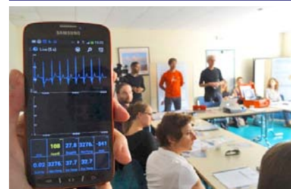
Présentation du projet SOS-MAM à Chamonix (Hôpitaux du Pays du Mont-Blanc)

Les travaux de préparation d'INTERREG V France-Suisse ont été lancés en 2014 avec la volonté d'aller plus loin dans la coopération et l'intégration du Canton de Fribourg dans le périmètre géographique. Plus ambitieux, l'enveloppe financière du futur programme bénéficie d'une enveloppe financière en forte augmentation (65,9 M€ de FEDER et l'équivalent de 40,75 M€ de fonds INTERREG suisses, contre respectivement 55 M€ et 14 M€ pour 2007-2013). Le Programme Opérationnel 2014-2020 a été soumis en août 2014 à la Commission européenne.