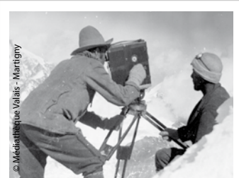
Tournage de la Croix du Cervin d'Emile Gos, 1922.