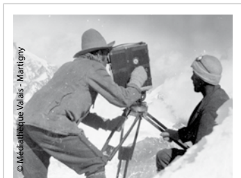
Tournage de la Croix du Cervin d'Emile Gos, 1922.