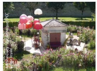
Aéline Dady - Bibliothèque PCC Sainte-Étienne

Mon double en jeux - Festival des jardins 2008