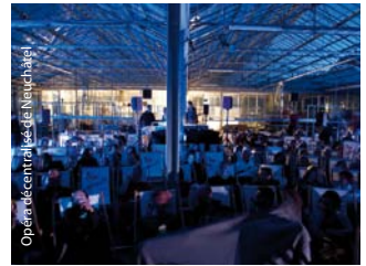
Opéra décentralisé de Neuchâtel