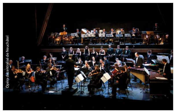
Opéra décentralisé de Neuchâtel

Le projet a pour objectif la mise en place de manifestations tel qu'un festival sur les sites du patrimoine du territoire concerné (Cernier en Suisse et Arc-et-Senans en France), dans une perspective de valorisation du patrimoine artistique et de l'innovation interdisciplinaire. Il s'agit de favoriser le transfert de méthodes de production, de programmation et de communication entre les partenaires du projet.