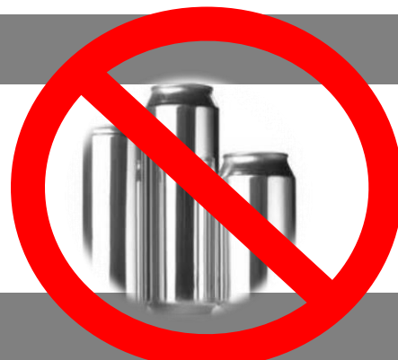
MEGAPHONES - HAMPES Rigides - BOUTEILLES Verre - BOITES Métal