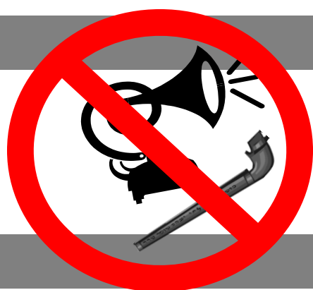
SONO Animation VUVUZELA